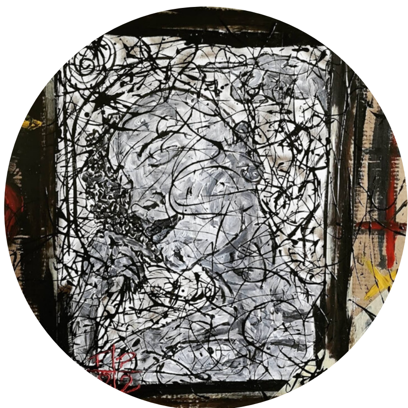
LOVE & FLOWERS ASFALTO E ACRILICO SU TELA E CARTONE 85X115

INDIRIZZO : VIA TINTA ROSSA, 2 MONTELIBRETTI (RM) TEL. : 348/0357690 E-MAIL : FRANCESCOPATANEART@GMAIL.COM INSTAGRAM : @FRANCESCOPATANE_ART FACEBOOK : FRANCESCO PATANÈ ART WEB : FRANCESCOPATANEART.COM