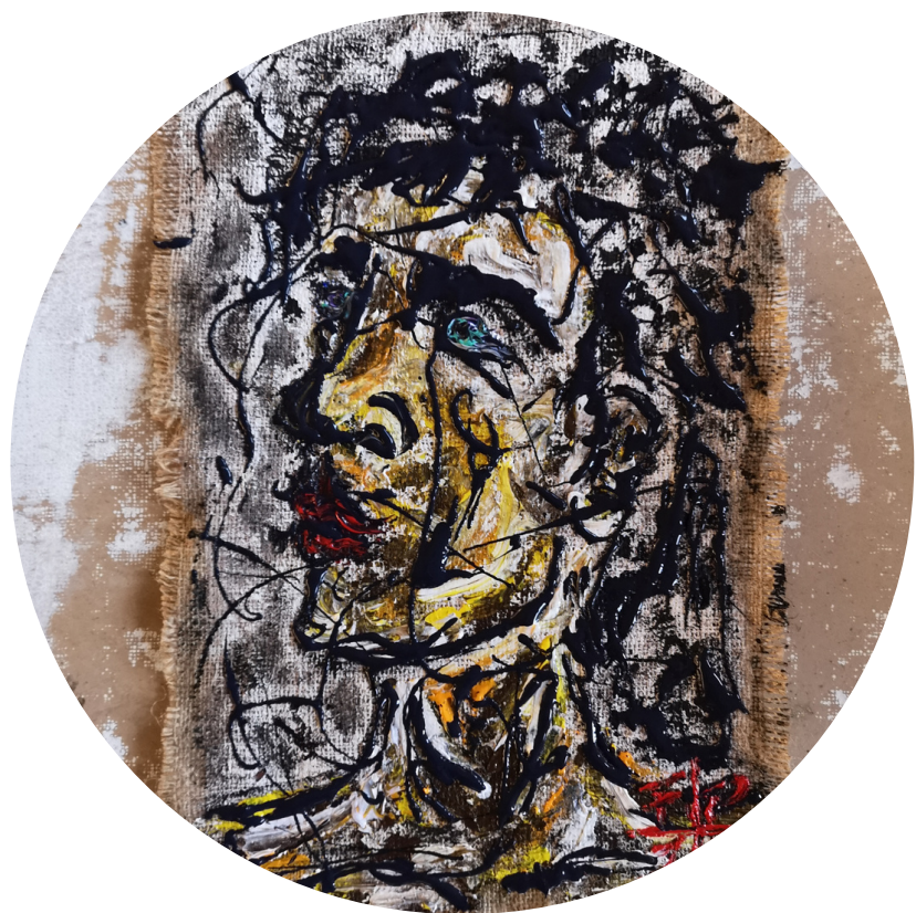
GENDER ASFALTO E ACRILICO SU JUTA 80X100

"ANIMA...QUESTO SI PERCEPISCE DAI SUOI OCCHI. MASCHIO O FEMMINA COSA IMPORTA? LA BELLEZZA SI NOTA DAI DETTAGLI CHE COMPONGONO LA SUA ESSENZA: FRAGILE, DELICATA E FORTE AL CONTEMPO. UN VIAGGIO INTROSPETTIVO CHE PARTE DALLO SGUARDO E ARRIVA AL CUORE. SIAMO ESSERI UMANI... BELLISSIMI NELLA NOSTRA