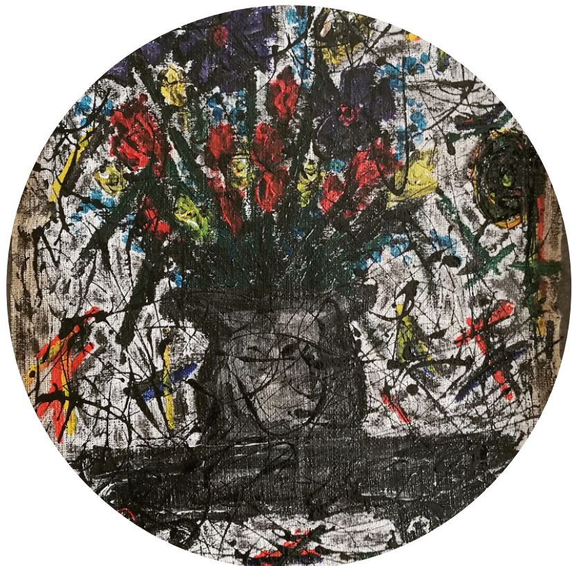
NATURA MORTA ASFALTO E ACRILICO SU JUTA 60X60