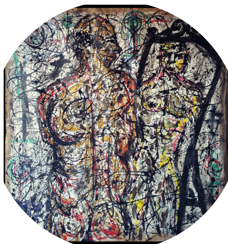
MODI DI ESSERE - WAYS OF BEING ASFALTO E ACRILICO SU JUTA 140X200

PERCHÉ AL DI FUORI DI UN GIUDIZIO BASATO SU CANONI CONTEMPORANEI SULLA "BELLEZZA" NESSUNO MAI PUÒ PLASMARE LA PROPRIA BELLEZZA.